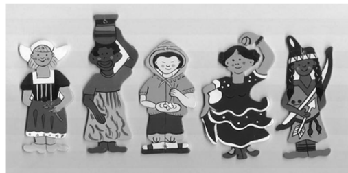
Stereotype und einseitige Darstellungen von Menschen

KINDERWELTEN - Fachstelle Vorurteilsbewusste Bildung und Erziehung